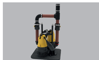
Pumpen nicht im Lieferumfang